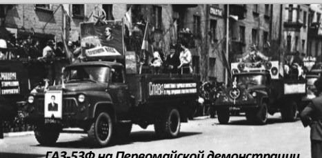
ГАЗ-53Ф на Первомайской демонстрации в г. Мелитополь (УССР). 1965 г.